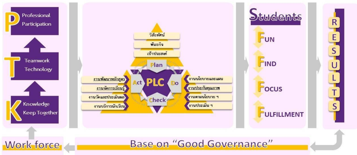
ภาพประกอบที่ 2 รูปแบบกระบวนการบริหารจัดการเรียนรู้ด้วย P.T.K. 4Fs Model ตามแนวคิด P.T.K. Re-Inventing

โรงเรียนมหาไถ่ศึกษาเมืองพล เป็นโรงเรียนประถมขนาดใหญ่ สังกัดสำนักงานคณะกรรมการส่งเสริมการศึกษาเอกชน สำนักงานศึกษาธิการจังหวัดขอนแก่น จัดหลักสูตรการเรียนการสอนตามหลักสูตรแกนกลางการศึกษาขั้นพื้นฐาน พุทธศักราช 2551 และหลักสูตรแกนกลางการศึกษาขั้นพื้นฐาน พุทธศักราช 2551 (ฉบับปรับปรุง พ.ศ. 2560) ตามโครงการโรงเรียนมาตรฐานสากล โรงเรียนได้รับอนุมัติเข้าโครงการพัฒนาประเทศไทยเป็นศูนย์กลางการศึกษา ในภูมิภาค (Education Hub) และเพื่อเป็นการสนองต่อความต้องการของผู้ปกครอง ชุมชน ผู้เรียน ที่มีความสนใจในการเรียนรู้ที่แตกต่างและหลากหลาย โรงเรียนจึงจัดโปรแกรมการเรียนการสอนให้ผู้เรียนได้เลือกเรียน ตามความสามารถ ความถนัด และความสนใจเทียบเคียงมาตรฐานสากลสู่ประชาคมอาเซียน ดังนี้ 1) โปรแกรมการเรียนการสอนตามหลักสูตรกระทรวงศึกษาธิการ เป็นภาษาอังกฤษ MIEP Program , ECP Program นอกจากนี้ยังได้จัดวิชา ภาษาต่างประเทศให้ผู้เรียนได้เรียนเพิ่มเติม ได้แก่ ภาษาจีน ซึ่งเป็นการดำเนินงานตามรูปแบบกระบวนการ บริหารจัดการเรียนรู้ด้วย P.T.K. 4Fs Model หมายถึง การพัฒนาหลักสูตรที่หลากหลายให้นักเรียนได้เลือก เรียนตามความสนใจ เพื่อให้ค้นพบตัวเอง (FIND) เรียนรู้อย่างมีความสุข (FUN) มีเป้าหมายของการเรียนรู้เพื่อทราบถึงอาชีพในอนาคต (FOCUS) และศึกษาต่อในระดับมัธยมศึกษาได้ตามเป้าหมาย (FULFILLMENT) รูปแบบกระบวนการบริหารจัดการเรียนรู้ด้วย P.T.K. 4Fs Model ตามแนวคิด P.T.K. Re-Inventing ดังแผนภาพที่ 2