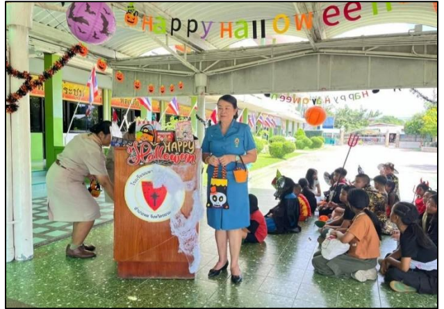
ร่วมแสดงความยินดีมอบรางวัลกำลังใจให้กับนักเรียนที่มีผลงานดีเด่น