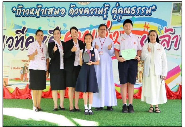
ผู้อำนวยการและผู้ปกครองเข้านิเทศและให้กำลังใจคุณครูในการจัดกิจกรรมการเรียนการสอน